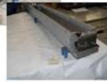
Profil W 01